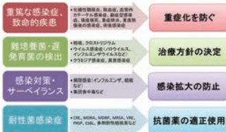
図1. 感染症における迅速検査の重要性